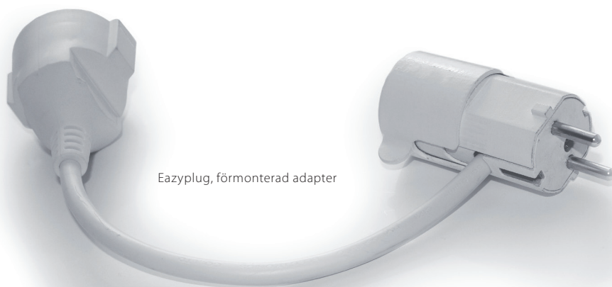
Eazyplug, förmonterad adapter

När du vrider till öppet läge och trycker in Eazyplug dras stiften in och hela kontakten skjuts ut ur vägguttaget.